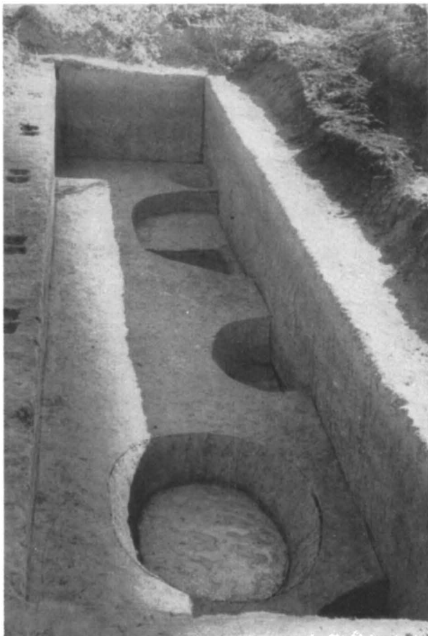
Fig. 2. Boian V. Vederea șanțului paralel cu secțiunea est-vest.

Din observațiile stratigrafice de pînă acum rezultă un fapt cert: și anume că stratul cu materiale de tip Dudești este suprapus de stratul cu piese de tip Gumelnița. Prin