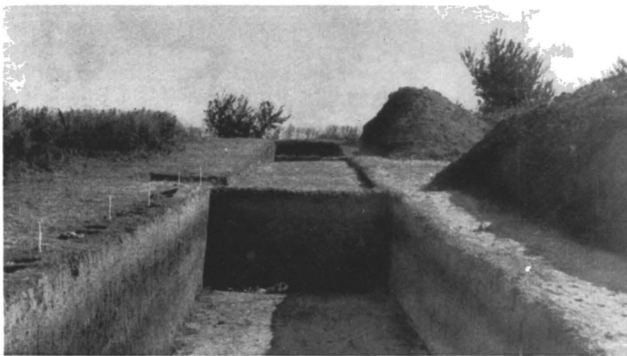
Fig. 1. — Boian A. Vederea secțiunii est-vest.

I. Așezarea Boian A. În cursul campaniei de săpături din toamna anului 1958 s-a început săparea unei secțiuni longitudinale (orientată E – V) prin porțiunea păstrată din așezarea străveche (fig. 1). În anul 1959 secțiunea a fost prelungită spre est, până